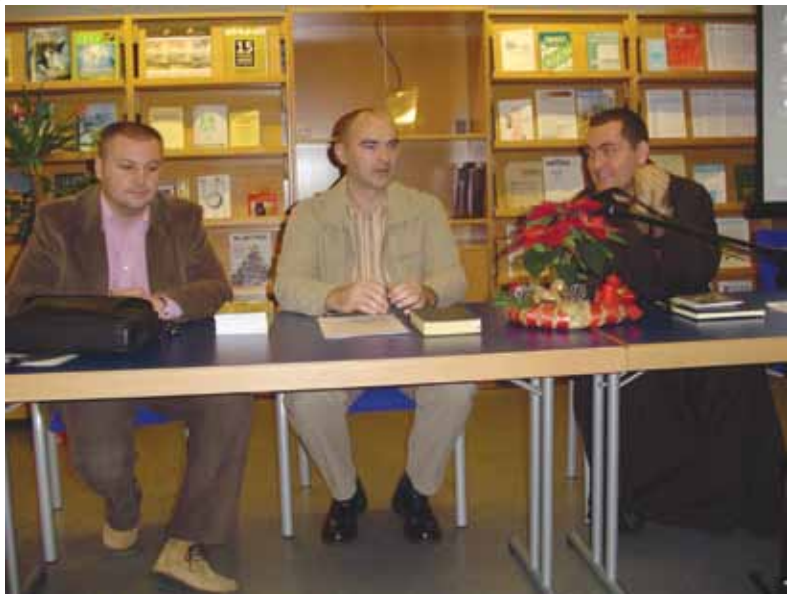
Tribina o religioznosti djece i mladih