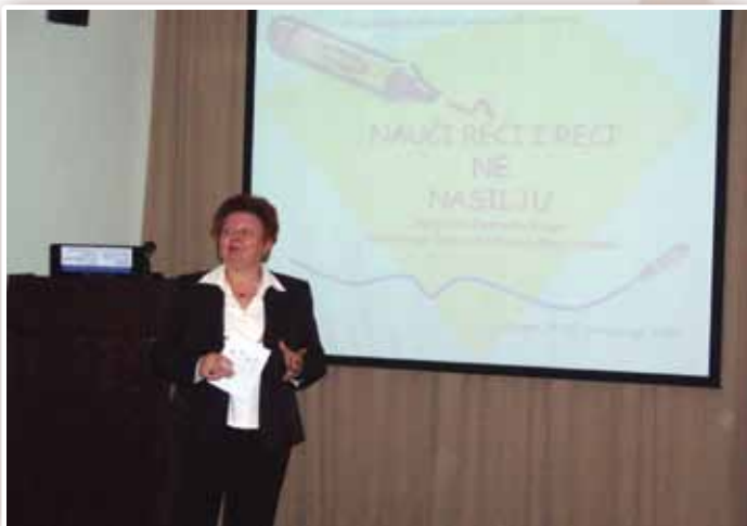
Aktivno sudjelovanje članova