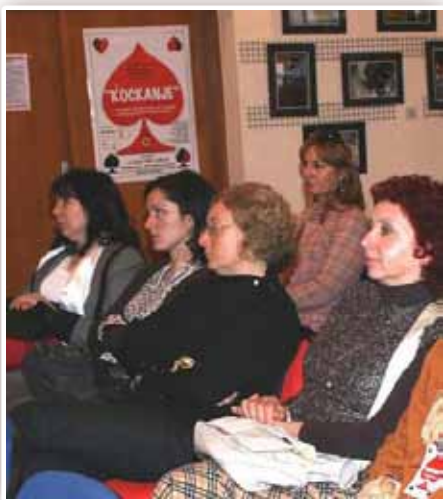
Psiholozi na simpoziju

za brzom zaradom, kockari i kockarnice nisu društveno negativno stigmatizirani. Budući da u našoj sredini nema epidemioloških podataka niti recentnih stručnih studija o patološkom kockanju, željeli smo pokrenuti znanstvenu zajednicu na početna istraživanja, pa vjerujem da će ovaj skup poticajno djelovati na mnoge stručnjake”, kaže dr. Đorđević. Neki su od zaključaka virovitičkog simpozija obitelji osoba oboljelih od patološkog kockanja trebaju podršku koja im se može i praktično ukazati organiziranjem udruge za pomoć i samopomoć, pa se nameće potreba osnivanja mreža udruga, sličnih udrugama liječenih ovisnika.