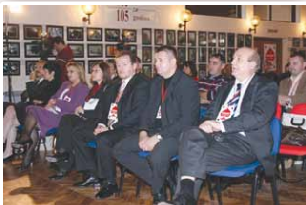
Simpozij o kockanju - uzvanici