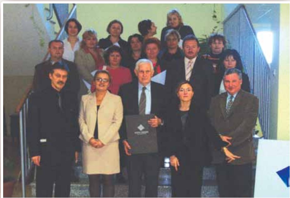
Skupština Društva psihologa Virovitičko-podravske županije